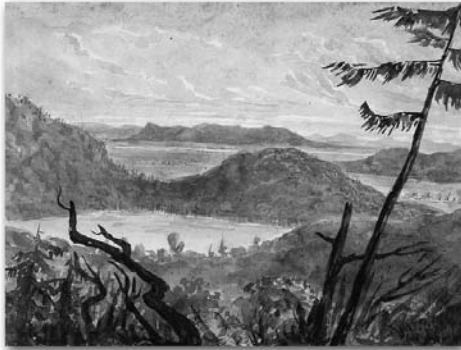
(Source: Archives nationales du Canada, Collection Philip John Bainbrigge, Vue du lac Yamaska (sic) à partir du mont Belœil)