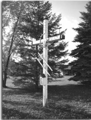
La dernière croix de chemin érigée sur le territoire de la Ville de Belœil.