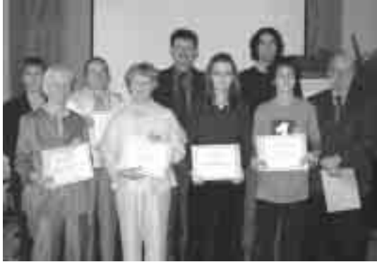
Les bénévoles de la SHBMSH récompensés.