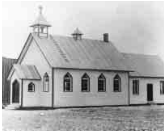
La First Belœil Presbyterian Church sur la rue Joffre à McMasterville

Bien qu'elle demeure discrète, une communauté protestante est présente à Belœil depuis plus d'un siècle. C'est en effet vers 1905 que la population d'origine écossaise et de dénomination presbytérienne fut assez importante pour fonder une congrégation. Au départ, la jeune communauté effectuait les cérémonies du culte dans les maisons privées.