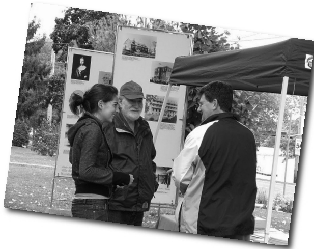
Photo prise durant les Journées de la Culture, Samedi le 24 septembre 2010.

Comme Yvon Deschamps se posait la question au sujet de la pertinence des Unions, je me pose la même question au sujet des Journées de la culture.