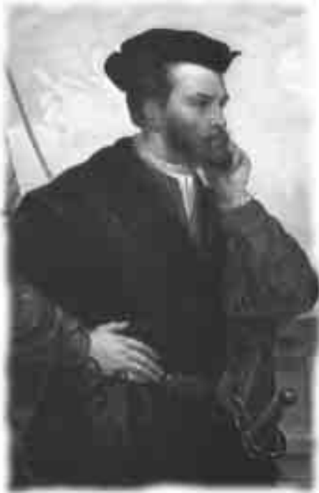
Jacques Cartier, peinture à l'huile de Théophile Hamel (Source : Le Monde de Jacques Cartier , p. 230)