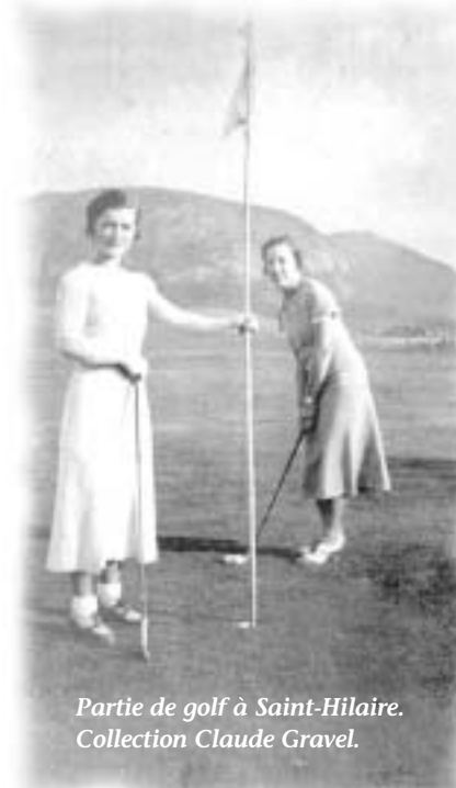
Partie de golf à Saint-Hilaire. Collection Claude Gravel.