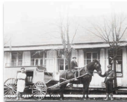
La boulangerie Armand Halde sur la rue Saint-Henri.

Le patron des boulangers est Saint-Honoré dont la fête est célébrée le 16 mai. Il fut un temps où le pain était sacré. Avant de l'entamer, le maître de la maison traçait, de la pointe du couteau, une petite croix sur la croûte dorée. Pas question de gaspiller une miette de pain!