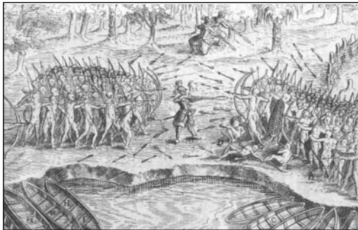
Défaite des Iroquois au lac de Champlain

Beaucoup de Québécois connaissent le lac qui forme aujourd'hui la frontière entre le Vermont et l'État de New York. Encaissé entre les Adirondacks, à l'ouest, et les Montagnes Vertes, à l'est, ce lac mesure environ 100 m du nord au sud et 15 m en largeur par endroits. Il servait autrefois, dit-on, de limite entre les territoires de chasse des Abénakis à l'est et les Agniers (Mohawks) à l'ouest.