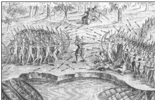
Défaite des Iroquois au lac de Champlain

Beaucoup de Québécois connaissent le lac qui forme aujourd'hui la frontière entre le Vermont et l'État de New York. Encaissé entre les Adirondacks, à l'ouest, et les Montagnes Vertes, à l'est, ce lac mesure environ 100 m du nord au sud et 15 m en largeur par endroits. Il servait autrefois, dit-on, de limite entre les territoires de chasse des Abénakis à l'est et les Agniers (Mohawks) à l'ouest.