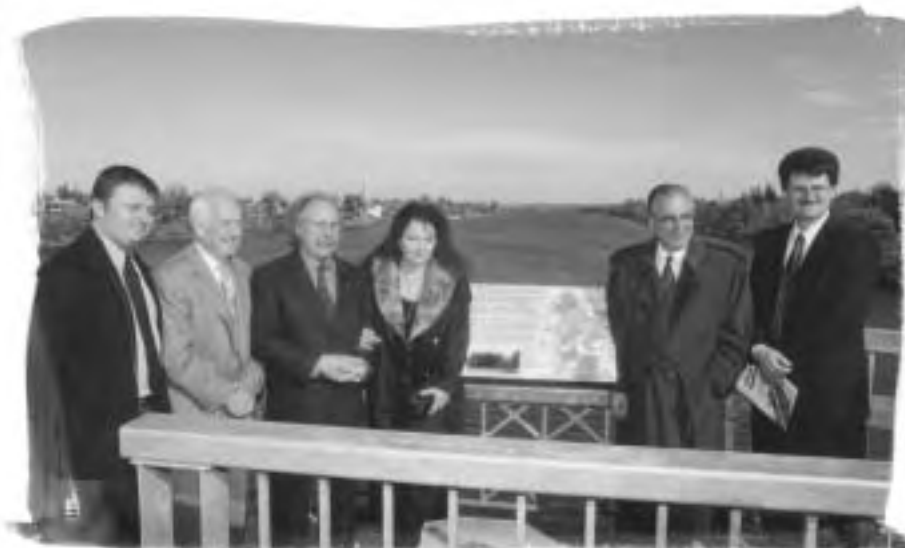
La plaque avant sa disparition