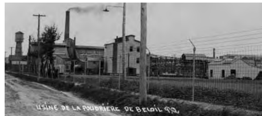
La poudrière de Belœil