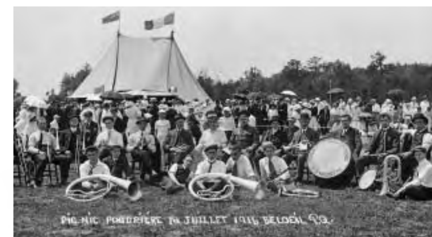
Pic-nic à La poudrière de Belœil, 1916