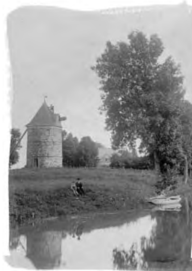
Paysage Saint-Marcois

Mondialement reconnu comme appartenant à l'Angleterre, l'archipel comprenant l'est de la Nouvelle-Guinée et les îles Salomon fut néanmoins revendiqué par la France en 1879 sous le nom de Nouvelle-France. Désirant coloniser ce vaste territoire, le marquis de Ray, un Breton nommé Charles de Breil, commença par développer un emplacement qu'il appela Cap Breton, au sud de l'île de la Nouvelle-Irlande (aujourd'hui partie de la Papouasie-Nouvelle-Guinée). Pour attirer les acheteurs, il vanta la qualité du sol et l'abondance d'ensoleillement. Le 16 janvier 1880, un premier contingent de 150 colons venus de France sur le voilier Chandernagore débarque au Cap Breton. Ils sont abandonnés dans cette jungle tropicale avec des vivres pour trois semaines et le matériel nécessaire à la construction d'un moulin, alors que le sol n'est pas du tout propice à la culture des céréales. La plupart des premiers colons sont morts de faim ou de la malaria. D'autres, plus chanceux, furent secourus et expatriés en Australie. Le marquis y expédia trois autres contingents, constitués cette fois d'Italiens, de Français, d'Allemands, de Belges et d'Espagnols. Heureusement tous n'aboutirent pas à Cap Breton. En fait, certaines parties de l'Australie ont été colonisées par ces Européens qui devaient en principe s'établir dans cette seconde Nouvelle-France.