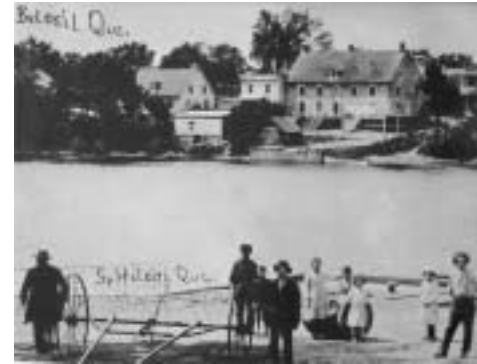
Le vieux-Moulin de Belœil vu du quai de Mont-Saint-Hilaire, c.1915

Le bâtiment connu aujourd'hui sous le nom Le Vieux-Moulin n'a été un moulin que pendant une très courte période. Construit vraisemblablement en 1799 par le négociant Louis Marchand, c'est le seul bâtiment de type monumental à Belœil et l'un des rares spécimens dans toute la Vallée du Richelieu. Sauf pour la courte période où il fut transformé en moulin à vapeur, Le Vieux-Moulin a abrité une suite ininterrompue de marchands et commerçants qui l'ont utilisé comme magasin et résidence, mais surtout comme hangar.