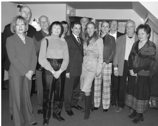
Lancement du Cahier.