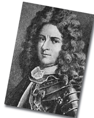
Pierre Le Moynes d'Iberville